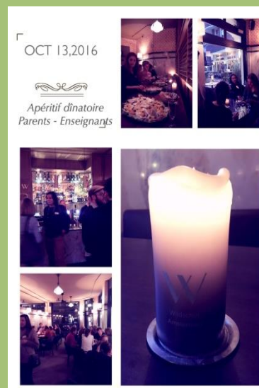
Apéro dinatoire Parents Enseignants