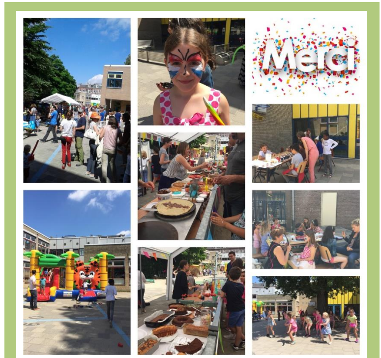
Kermesse de fin d'Année 2016-2017 sur le thème du Cirque

A cette occasion, l'A IPL a acheté et distribué de petits œufs en chocolat à l'ensemble des élèves.