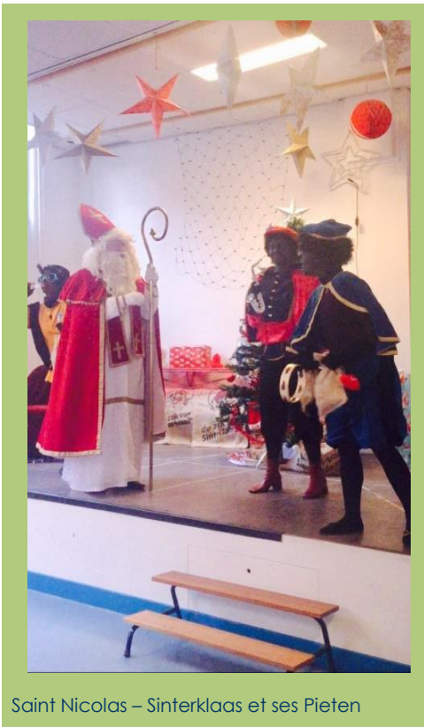
Saint Nicolas – Sinterklaas et ses Pieten